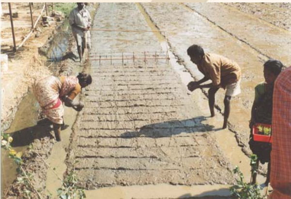
మార్కరు గుర్తుల ఆధారంగా నాటు వేయడం