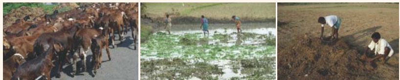
గొర్రెలతో మంద కట్టడం పచ్చి రొట్ట పెంటపోగు

ఇది సాంప్రదాయంగా పాటిస్తున్న పద్ధతే. పశువులు, గొర్రెలు, మేకలను మందలు, మందలుగా పాలాల్లో రాత్రిపూట విడిచిపెడతారు. వాటి మూత్రం, పేడ వల్ల నేల సారవంతమవుతుంది.