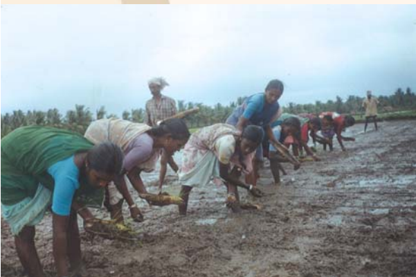
నారు తీయడానికి ఉపయోగించే రేకులు

మామూలు పద్ధతిలో వరి మొక్కను పట్టుకుని నారు పీకుతారు. దీనిని నారు లాగటం అంటారు. శ్రీ పద్ధతిలో నారు మొక్క చాలా చిన్నగా ఉంటుంది. కాబట్టి మంద పాటి ఇనుప రేకుని మడిలో అడుగు భాగానికి (3-4 అంగుళాల కింద నుంచి) చొప్పించి నారుని మట్టితో పాటు పైకి లేపాలి. అంటే ఇనుప రేకు మీదకి నారు, మట్టి వస్తాయి. దీనిని బొచ్చె/తట్ట వంటి వాటిల్లోకి మార్చి గానీ లేదా రేకుమీదే నాటు వేసే పాలానికి తీసుకెళ్ళాలి. నారు పీకిన తరువాత సాధ్యమైనంత త్వరగా (వీలయితే అరగంటలోపల) నాటు వేస్తే మొక్క దెబ్బతినకుండా ఉంటుంది.