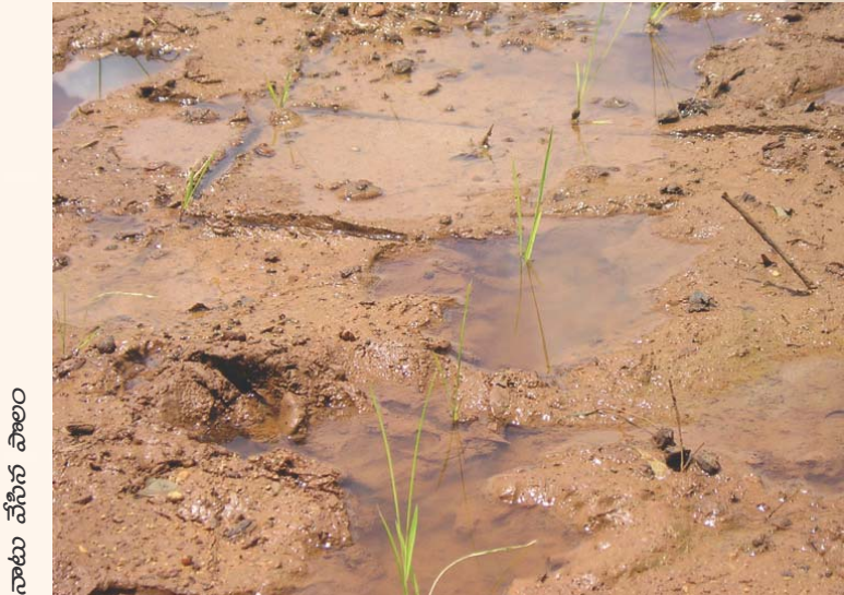
నాటు వేసిన పొలం

మడి నుంచి నారు తీసిన తరువాత వెంటనే ప్రధాన పొలంలో నాటడం వల్ల ప్రయోజనం ఉంటుంది. బలమైన వేళ్ళు వృద్ధి చెందడానికి, తరువాత మొక్క తన పూర్తి సామర్థ్యంతో దిగుబడులు ఇవ్వడానికి ఇది తోడ్పడుతుంది.