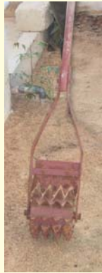
సింగిల్ డ్రమ్ వీడర్